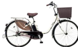
【新バスケット採用のビビ・DX】