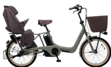
ギュット・アニーズ・EX