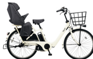
ギュット・アニーズ・DX・26