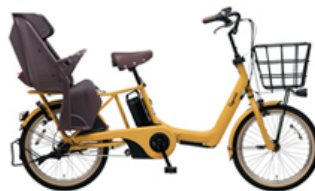
【乗せ降ろしがしやすくなったギュット・アニーズ・DX】