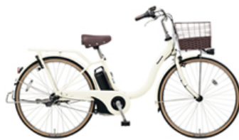
【新開発のフレームを採用したティモ・L】