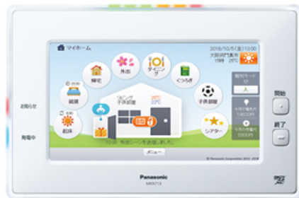
【AiSEG2(7型モニター機能付) (MKN713)】