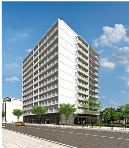
大阪大学箕面新キャンパス学寮 完成予想イメージ