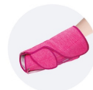
足裏巻きに巻き変え「足うら」コース