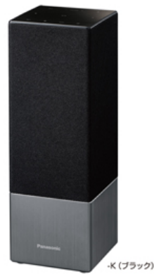
ワイヤレススピーカーシステム「SC-GA10」 (2018年5月 パナソニック)