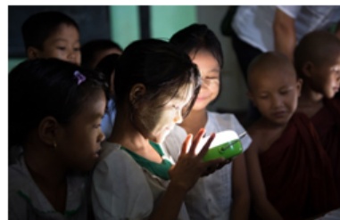
【ソーラーランタンの明かりに喜ぶミャンマー の小学生生徒】