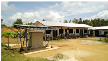
【インドネシアのプロジェクト活動地に設置された パワーサプライステーション(西カリマンタン州)】

当社は自社技術・製品を活用し「事業を通じて社会の発展に貢献する」ことを基本に、重点テーマとして「共生社会の実現に向けた貧困の解消」を掲げて企業市民活動(社会貢献活動)を推進しています。無電化地域への取り組みでは、これまでに合計10万台のソーラーランタンを届ける「ソーラーランタン10万台プロジェクト」などを行ってきました。今年3月からは、一般の皆様のご協力もいただきながら、クラウドファンディングや古本による寄付を通じて無電化地域に“あかり”を届ける「みんなで“AKARI”アクション」を開始しています。