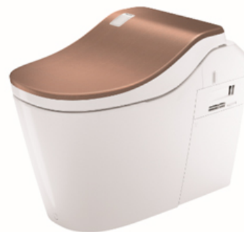
【便ふた：銅（アカガネ）】