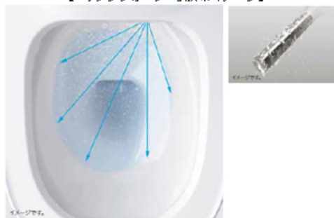
【「オゾンウォーター」散布イメージ】