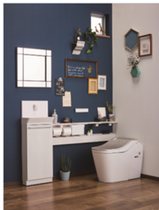
【「アラウーノ」 L150シリーズ施工例】