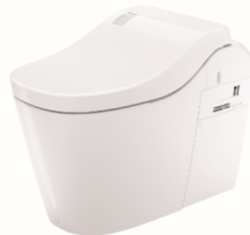
【「アラウーノ」 L150シリーズ】