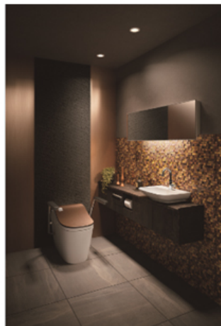
【「アラウーノ」 L150シリーズ施工例】