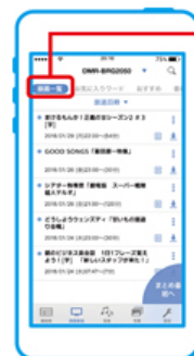
録画一覧から録画番組が見られる

さらに、話題のドラマやアニメの番組ニュース(※10)をアプリでお知らせ。記事に関連する番組をその場で視聴や録画予約をすることもできます。