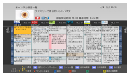
<チャンネル録画一覧>