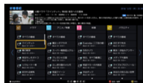
<新着番組・ジャンル>

「新着番組」は世間で人気の番組や、自分自身がよく見る番組を自動で整理して表示してくれるので、休日などに録画番組をまとめて見る際に便利です。事前にお気に入りの番組名、好きなタレントの名前やキーワードを登録しておけば、その条件に合った番組や番組内の出演シーン・関連シーンをリストからかんたんに確認することもできます(※19)。