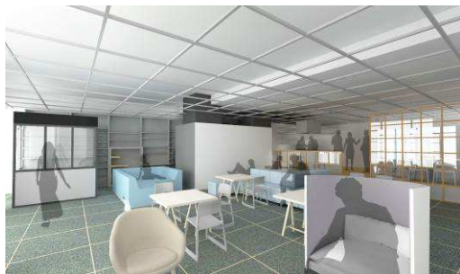
イノベーションスタジオイメージ(7 月開所予定)

Tsunashima SST SQUARE1 階に位置し、タウンサービスや街のさまざまな活動の中核を担うマネジメント拠点、災害時の支援拠点の他、イノベーション創出のための拠点。パナソニックが技術・マーケティング実証を行うなど、さまざまなオープンイノベーションを創出するためのスペース「イノベーションスタジオ」、国際交流・地域交流、知の交流の促進や、街の情報発信のためのスペース「エクステンジスタジオ」、セキュリティサービスなどの拠点となる「タウンサービススペース」などがあります。