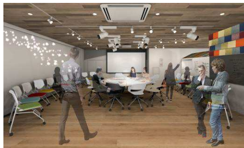
エクステンジスタジオイメージ