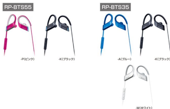
ワイヤレスステレオヘッドホン「RP-BTS55」「RP-BTS35」 (2018年3月 パナソニック)