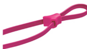
クイックフィットアジャスター