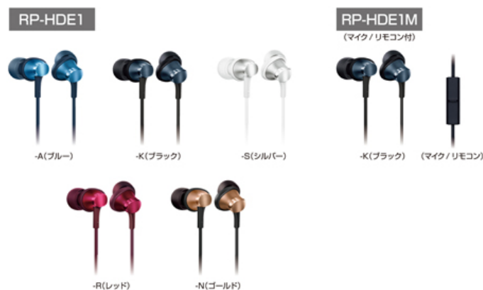
ステレオインサイドホン「RP-HDE1」「RP-HDE1M」 (2018年3月 パナソニック)