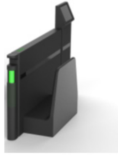
ウォークスルー型 RFID 会計レーン