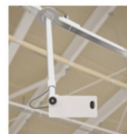
トライアルカンパニー社 スマートカメラ

トライアルが独自に開発した画像認識エンジンと連動したスマートカメラにより、商品棚の商品陳列、商品接触を分析します。商品棚にフォーカスすることで、プライバシーを守りながら商品動向の可視化・定量化が24時間可能になります。