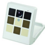
パナソニックVieureka対応 スマートカメラ (エルモ社製 VRK-C201)

パナソニックのVieurekaプラットフォームとPUX株式会社の画像認識エンジンにより、カメラ内で来客の属性と行動の分析を行い、その結果のみをクラウドに直接送信。これによりプライバシーを守りながら来客の行動の可視化・定量化が24時間可能になります。