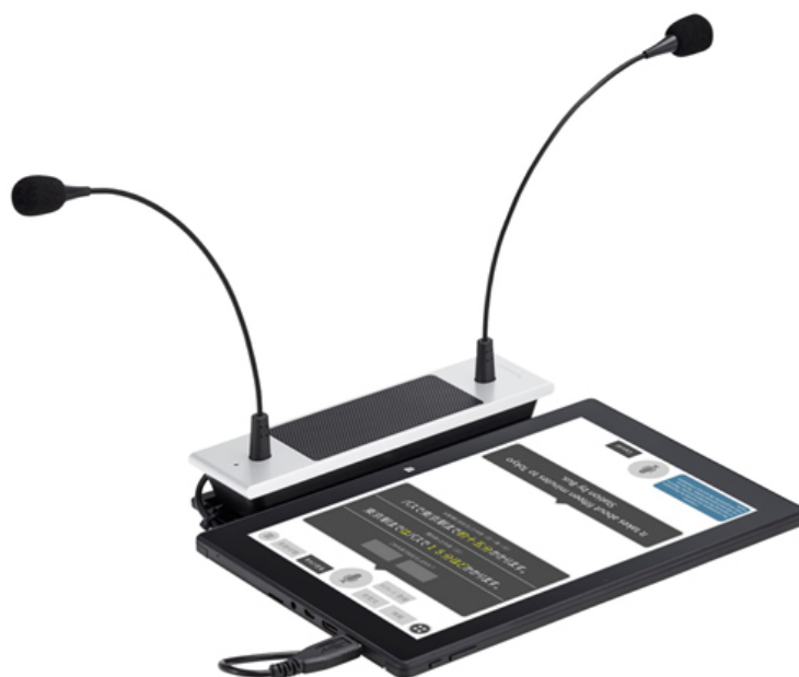
「対面ホンヤク」端末 2017年11月 パナソニック株式会社