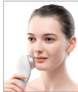
使用シーン（イメージ）