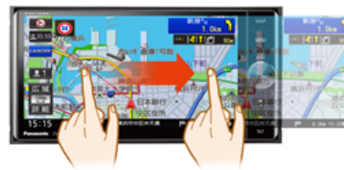
指先に地図が吸い付くように素早く反応