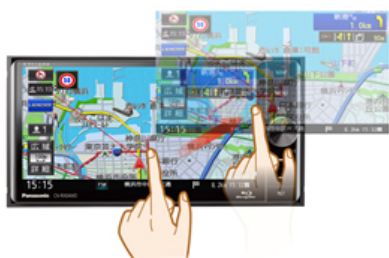
指の動きに即座に追従

指の動きにあわせて直感的に反応。自然でなめらかな操作感を実現する「ダイレクトレスポンス」を新搭載。画面上のドラッグは上下や斜め等、あらゆる方向の指の動きに素早く反応、地図のスクロールもスライドした指の移動距離分を吸い付くように素早く移動。フリックによる地図スクロールでは、フリックの速度にあわせて地図の移動も敏感に反応し、目的の地点へストレスなく、地図移動が可能です。