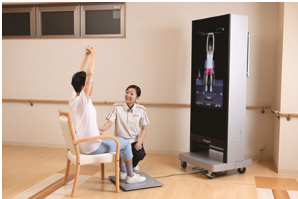
リハビリナビゲーションシステム【デジタルミラー】