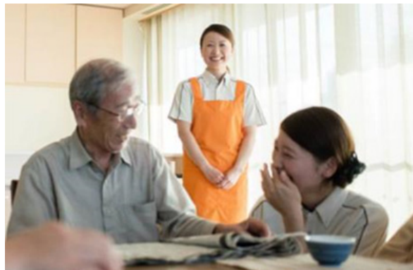
利用者全体に常に目を配る【見守り責任者】 (デイサービス)

当社の在宅介護サービス拠点では、2001年より品質マネジメントシステムISO9001認証を取得しています。この取り組みの代表例として、デイサービス、ショートステイでの万一の転倒防止を当社独自に定量化し、低減しています。具体的には、サービス現場において、利用者全員に常に目を配る「見守り責任者」を配置することで、利用者の初動をいち早く察知し、スタッフ間連携により転倒を回避するなど、適切な介助を実践しています。