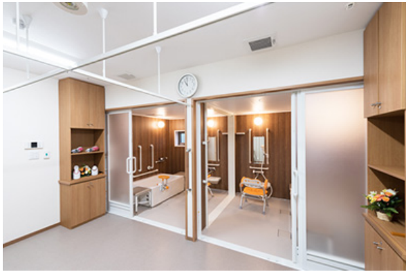
高齢者施設向けユニットバス【アクアハート】