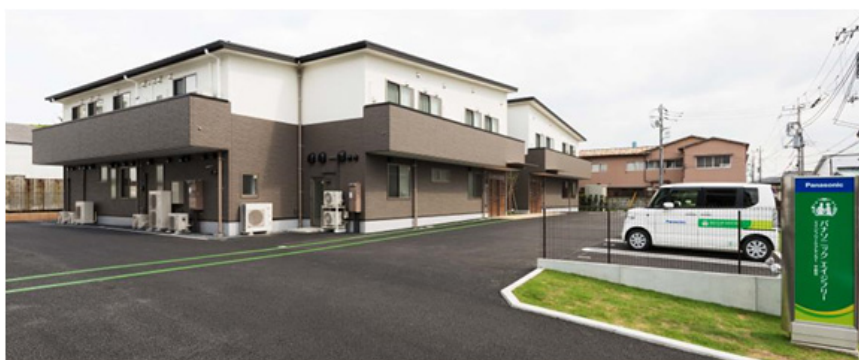
【パナソニック エイジフリーケアセンター宇都宮 外観】