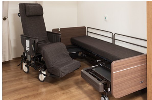
離床アシストロボット【リショーネPlus】