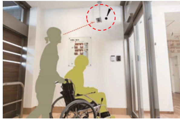
高齢者施設向け見守りシステム【顔認証システム】