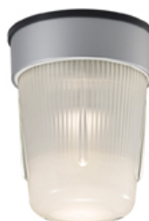
レンジフード向けLED照明器具 (天井面 / 壁面取付専用)