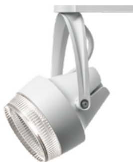
彩光色 LEDスポットライト