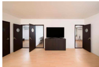
【比較体感コーナー】