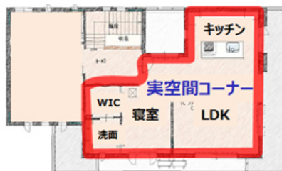
LDKと寝室空間で構成された「実空間コーナー」

※4:「みかけや形は原物そのものではないが、本質的あるいは効果としては現実であること」を人工的に作り出す技術の総称