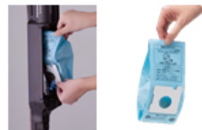
ゴミの舞い上がりを抑える