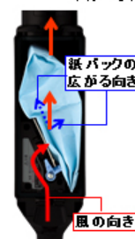
パワーロスを抑いだ風路構成

※4:MC-PBU510J(集じん容積0.5L)とMC-SBU510J(集じん容積0.2L)の比較。