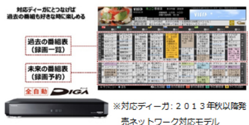
※対応ディーガ: 2013年秋以降発売ネットワーク対応モデル

番組表で番組を探していた方には、同時にシームレスで録画番組をご利用いただけます。全自動ディーガと合わせて使用いただくと、過去番組表(録画一覧)が充実し、より便利にご利用いただけます。