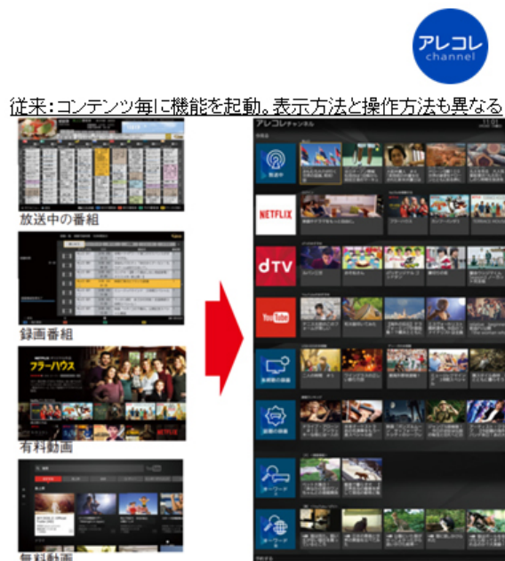
従来:コンテンツ毎に機能を起動。表示方法と操作方法も異なる

さらに、キーワード設定にも対応しています。自分の好きなタレントやジャンルをあらかじめ登録しておけば、該当のキーワードに関連するコンテンツを自動的に集めてくれるので、従来の番組表では気付けなかったコンテンツに出会うこともできます。お客様に合わせたカスタマイズ機能も充実しており、列毎の表示・非表示の切替えや表示順の変更など、番組表の新しい形を提案してまいります。