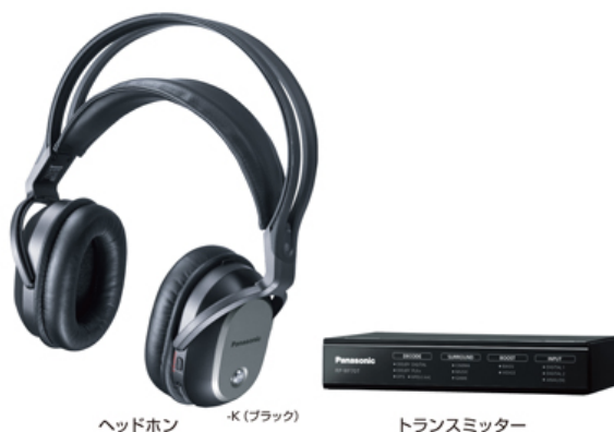
デジタルワイヤレスサラウンドヘッドホンシステム「RP-WF70」 (2017年3月 パナソニック)