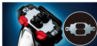
↑ クリアコーティングが 施されている部分

クリアコーティングにより、泡やジェルを落としやすく、水垢などの汚れにつきにくくしました。