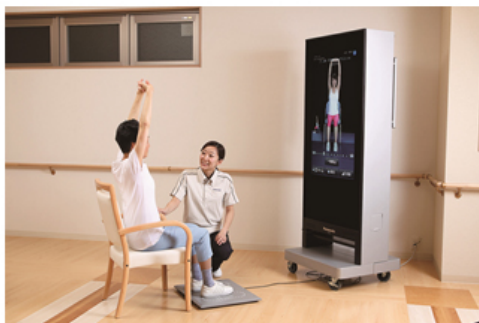
リハビリナビゲーションシステム 【デジタルミラー】