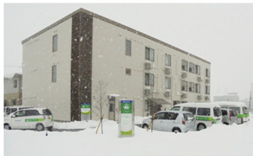
【パナソニック エイジフリーケアセンター彦根駅東 外観】

パナソニック株式会社 エコソリューションズ社 エイジフリービジネスユニット傘下のパナソニック エイジフリー株式会社は「泊まり」通い「訪問」の複数の介護サービスを提供する在宅介護サービス拠点「パナソニック エイジフリーケアセンター彦根駅東」を2017年2月1日に開設する予定です。