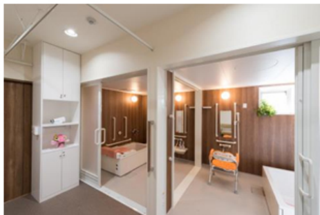
高齢者施設向けユニットバス 【アクアハート】