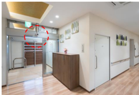
高齢者施設向け見守りシステム 【顔認証システム】