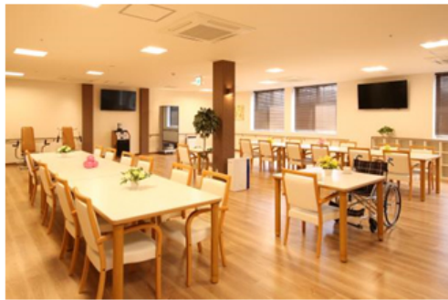
【デイサービス 機能訓練室兼食堂】