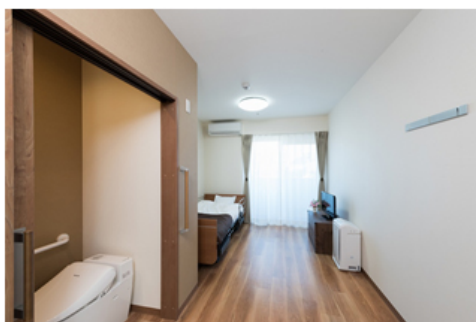
【ショートステイ 居室】