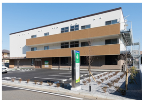
【パナソニック エイジフリーケアセンター柏豊住 外観】