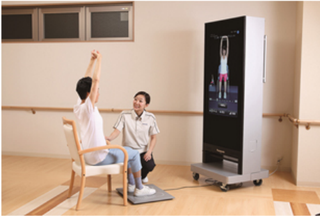
リハビリナビゲーションシステム 【デジタルミラー】