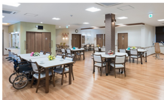
【デイサービス 機能訓練室兼食堂】

パナソニック株式会社 エコソリューションズ社 エイジフリービジネスユニット傘下のパナソニック エイジフリー株式会社(以下、パナソニック エイジフリー)は「泊まり」通い「訪問」の複数の介護サービスを提供する在宅介護サービス拠点「パナソニック エイジフリーケアセンター柏豊住(以下、エイジフリーケアセンター柏豊住)」を2017年2月1日に開設する予定です。