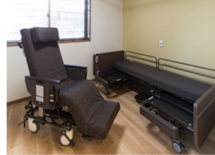
離床アシストロボット 【リショーネPlus】