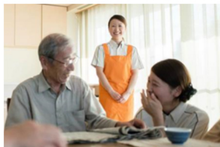
利用者全体に常に目を配る見守り責任者

パナソニック エイジフリー株式会社の在宅介護サービス拠点では、2001年より品質マネジメントシステムISO9001認証を取得しています。この取り組みの代表例として、デイサービス、ショートステイでの万一の転倒防止を当社独自に定量化しその低減を図っています。具体的には、サービス現場において、利用者全体に常に目を配る見守り責任者を配置することで、利用者の初動をいち早く察知し、スタッフ間の連携により、転倒を回避するなど、適切な介助を実践しています。