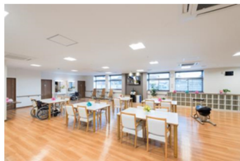
【デイサービス 機能訓練室兼食堂】

パナソニック株式会社 エコソリューションズ社 エイジフリービジネスユニット傘下のパナソニック エイジフリー株式会社 (以下、パナソニック エイジフリー)は「泊まり」通い「訪問」の複数の介護サービスを提供する在宅介護サービス拠点「パナソニック エイジフリーケアセンター高松木太 (以下、エイジフリーケアセンター高松木太)」を2016年12月1日に開設する予定です。