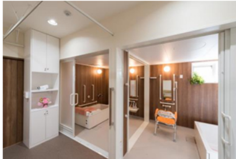
高齢者施設向けユニットバス 【アクアハート】