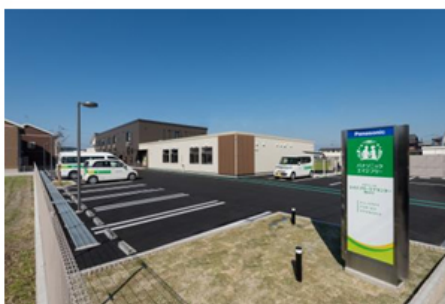
【パナソニック エイジフリーケアセンター高松木太 外観】