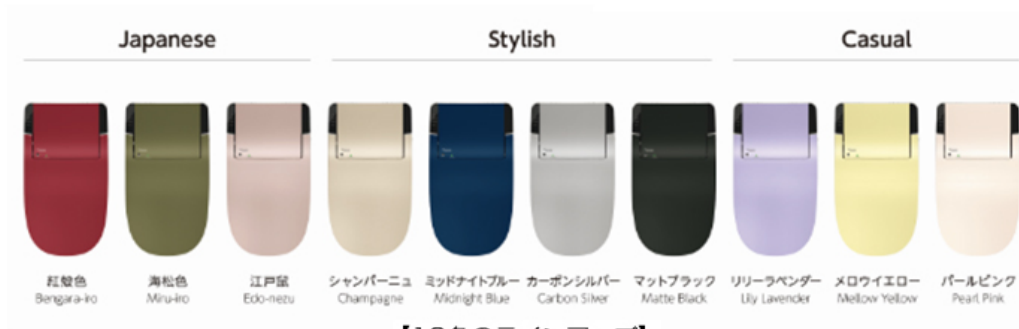
【10色のラインアップ】