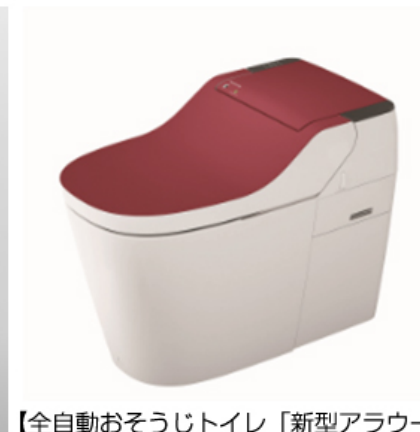
【全自動おそうじトイレ「新型アラウーノ」】 紅殻色（ベンガライロ）