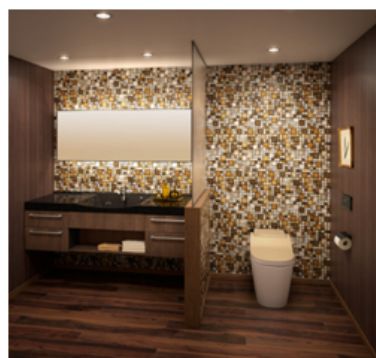
Stylish (スタイリッシュ) 【コーディネート例】