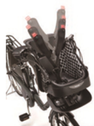
伸び縮みする巻取り式シートベルト

また、お子さまの成長に合わせて高さ調節が可能なヘッドレストや足をのせるステップ部分の調整にはワンタッチ機能を採用。お子さまを抱えたままの状態でも片手で簡単に調整できます。