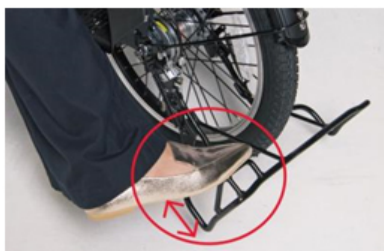
小柄な方でも足が届きやすくなった「もっと!かろやかスタンド2」

幼児2人同乗対応基準適合車は、後ろにお子さまを乗せても、重みで押し歩きの登り坂などで後ろにひっくり返らないように自転車の全長を長めに設計することと定められています。そのため、小柄な方ではハンドルを持ちながら足を伸ばしても、足がスタンドまで届きにくい場合があります。本製品では、スタンドの足踏み部分の形状を工夫(特許出願中)することで駐輪がしやすくなり、ふらつきにくい安定した駐輪をサポートします。