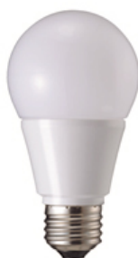
【一般電球タイプ】 (口金E26)