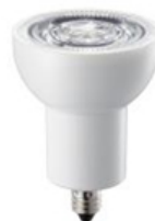
【ハロゲン電球タイプ】 (口金E11)