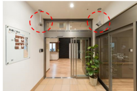
高齢者施設向け見守りシステム 【顔認証システム】