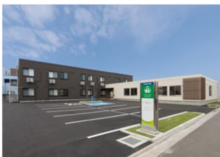
【パナソニック エイジフリーケアセンター和歌山北島 外観】