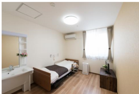
【ショートステイ 居室】