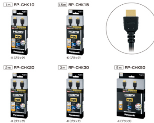
HDMIケーブル (4Kハイグレード) (2016年10月 パナソニック)