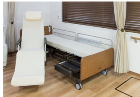
離床アシストベッド 【リジョーネ】