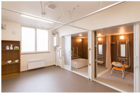
高齢者施設向けユニットバス 【アクアハート】