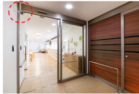
高齢者施設向け見守りシステム 【顔認証システム】