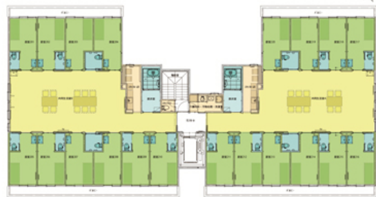
【2階 ショートステイ】