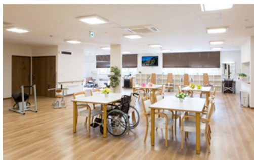
【デイサービス 機能訓練室兼食堂】

パナソニック株式会社 エコソリューションズ社 エイジフリービジネスユニット傘下のパナソニック エイジフリー株式会社(以下、パナソニック エイジフリー)は「泊まり」通い「訪問」の複数の介護サービスを提供する在宅介護サービス拠点「パナソニック エイジフリーケアセンター札幌白石(以下、エイジフリーケアセンター札幌白石)」を2016年10月1日に開設する予定です。