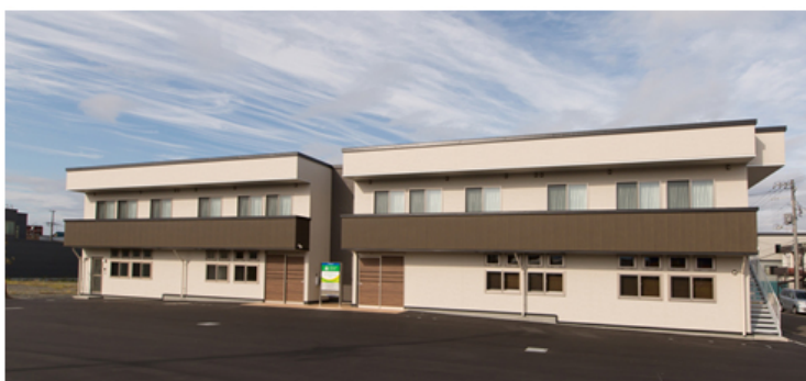
【パナソニック エイジフリーケアセンター札幌白石 外観】