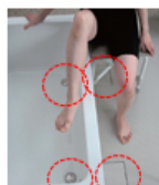
排水口を気にせず足を下ろせる