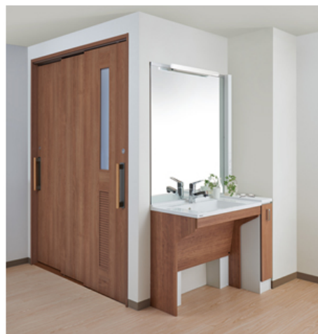
【アクアハート洗面 サイドキャビネットプラン】