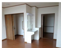
写真:当社、高齢者施設居室の一例

居室内での使用環境に合わせて、インテリア性と使いやすさに配慮。居室内で目に入りやすい側面のパネルに3種類の木目柄を追加しました。パナソニックの内装ドアや収納用建具(ペリティスシリーズ)とコーディネートができます。