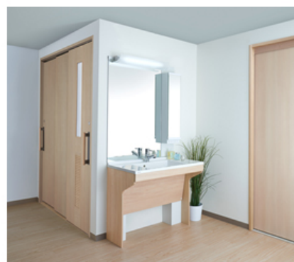
【アクアハート洗面 幅900mm】