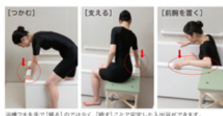
掴みやすく、押しやすい浴槽フチ70mm