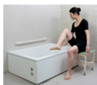
またぎやすい浴槽高さ400mm