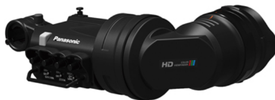
1.5型HDビューファインダー AJ-CVF50G