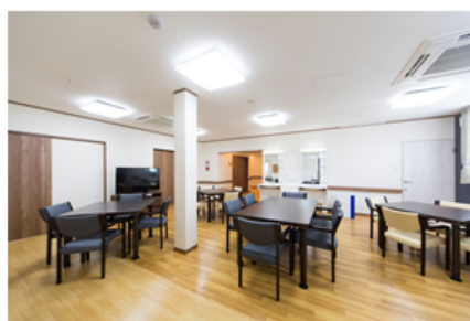
【サービス付き高齢者向け住宅 食堂・談話室】