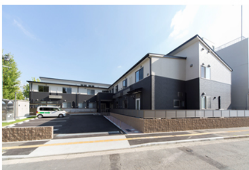
【パナソニック エイジフリーハウス名古屋上社 外観】