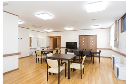
【小規模多機能型居宅介護リビング】