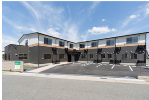
【パナソニック エイジフリーハウス名古屋篠の風 外観】