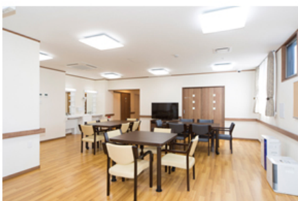
【小規模多機能型居宅介護リビング】