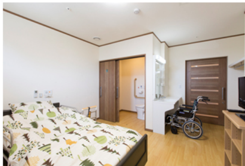
【サービス付き高齢者向け住宅 居室】