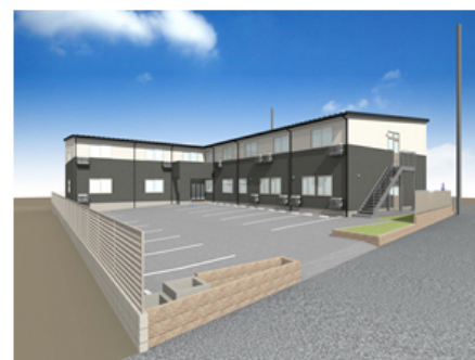
【パナソニック エイジフリーハウス岡崎六名 外観 (イメージ)】

パナソニック株式会社 エコソリューションズ社 エイジフリービジネスユニット傘下のパナソニック エイジフリー株式会社(以下、パナソニック エイジフリー)は、サービス付き高齢者向け住宅「パナソニック エイジフリーハウス(以下、エイジフリーハウス)」の中部地方初展開となる「パナソニック エイジフリーハウス名古屋篠の風(以下、エイジフリーハウス名古屋篠の風)」を含む合計3拠点を、2016年10月1日より順次オープンする予定です。