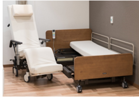
離床アシストベッド 【リシヨーンネ】