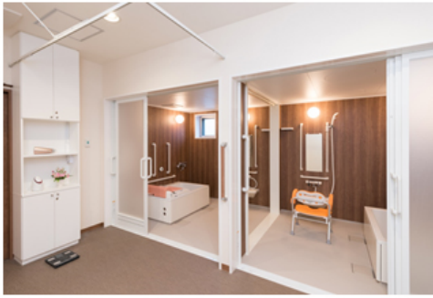
高齢者施設向けユニットバス 【アクアハート】