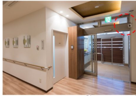
高齢者施設向け見守りシステム 【顔認証システム】