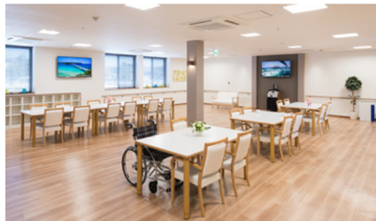
【デイサービス 機能訓練室兼食堂】

パナソニック株式会社 エコソリューションズ社 エイジフリービジネスユニット傘下のパナソニック エイジフリー株式会社(以下、パナソニック エイジフリー)は「泊まり」通い「訪問」の複数の介護 サービスを提供する在宅介護サービス拠点「パナソニック エイジフリーケアセンター徳島万代(以下、エイジフリーケアセンター徳島万代)」を2016年9月1日(木)に開設する予定です。