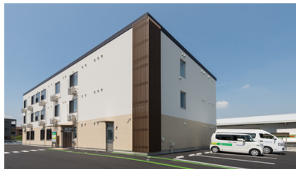
【パナソニック エイジフリーケアセンター徳島万代 外観】