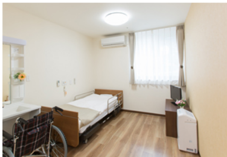
【ショートステイ 居室】