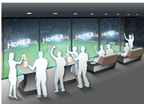
図1: 高臨場感プレミアム空間演出ソリューション(イメージ)

[*2] http://www.ntt.co.jp/news2015/1501/150128a.html