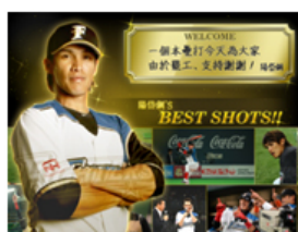
図4:台湾からの観光客向けの解説情報の画面例

また、これらのビジュアル演出や解説情報については、多言語による情報提供も可能となるため、増加する訪日外国人ファンに対するホスピタリティ向上にも貢献することが期待されます。(図4参照)