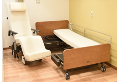
離床アシストベッド 【リジョーネ】