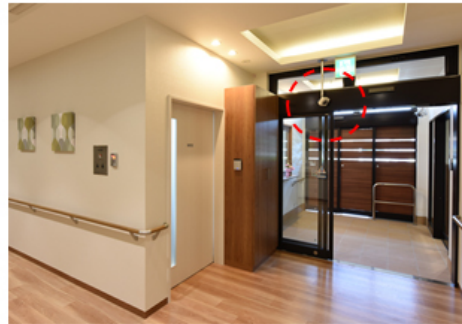
高齢者施設向け見守りシステム 【顔認証システム】