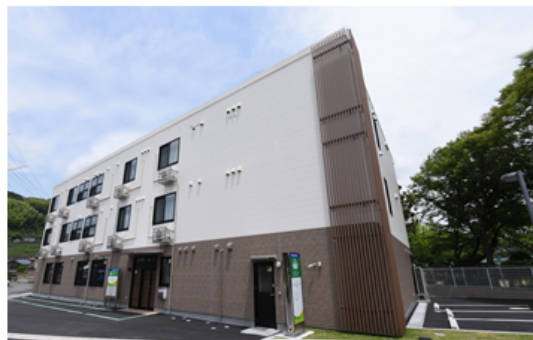
【パナソニック エイジフリーケアセンター山口周南 外観】