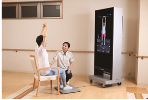
リハビリナビゲーションシステム 【デジタルミラー】