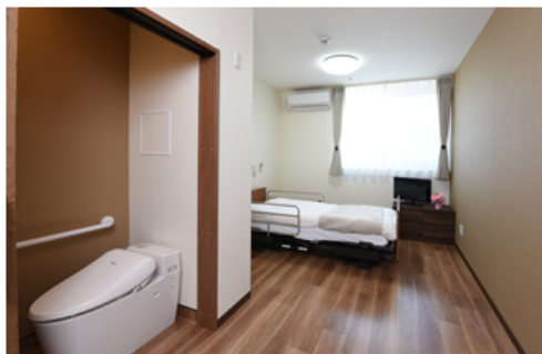
【ショートステイ 居室】