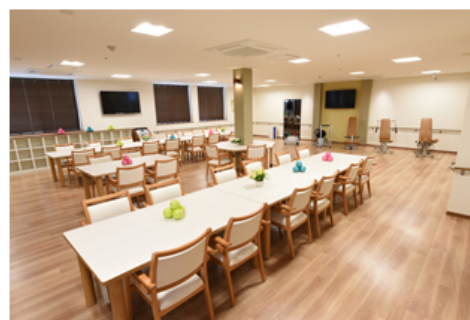
【デイサービス 機能訓練室兼食堂】

パナソニック株式会社 エコソリューションズ社 エイジフリービジネスユニット傘下のパナソニック エイジフリー株式会社(以下、パナソニック エイジフリー)は「泊まり」通い「訪問」の複数の介護サービスをワンストップで提供するショートステイ付き在宅介護サービス拠点「パナソニック エイジフリーケアセンター山口周南(以下、エイジフリーケアセンター山口周南)」を2016年8月1日(月)に開設する予定です。