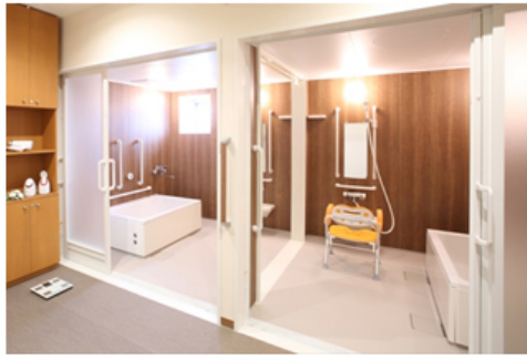
高齢者施設向けユニットバス 【アクアハート】