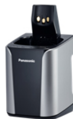
全自動洗浄充電器