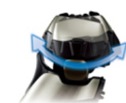
【3Dアクティブサスペンション】

ヘッド部分が前後・左右・上下に可動。アゴ下や頬の凹凸に均一に圧力がかかりやすく、肌にやさしく密着します。前後の可動が約17°から約20°に広がりました(※1)。また、前モデル(※4)で好評のスムーズローラーを引き続き搭載。肌にあてて動かしたときに回転する2つのスムーズローラーが肌への摩擦を減らして、肌にやさしくスムーズな剃り心地を実現します。