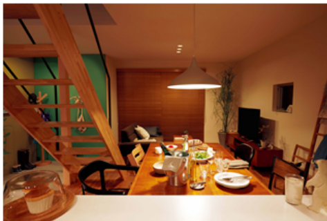
【シンフォニーライティングのイメージ例】

パナソニック株式会社 エコソリューションズ社の提供する住宅用照明設計提案「あかりプラン」が、このほど、1985年の開始から30周年を迎え、累計で400万件を達成しました。これは、お客様の住まいに合わせて、専門のプランナーが照明をトータルに提案する無料のサービスで、2020年度までに累計500万件を提案し、照明の効果的な組み合わせで省エネと快適空間を実現する「シンフォニーライティング」の浸透を図っていきます。