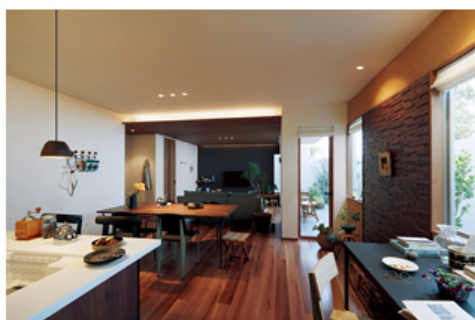
【シンフォニーライティングのイメージ例】