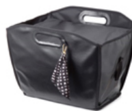
オプションのバスケットインナーボックス