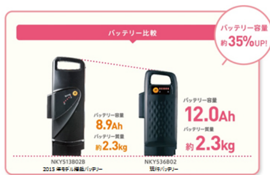
コンパクトサイズを実現