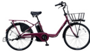
ギョット・ステージ・22 (BE-ELMU23)