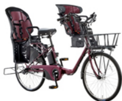
オプションのチャイルドシートを 装着することで3人乗りに

標準装備のフロントバスケットは線材が太く高さを低くしたこだわりのデザインで、見た目の美しさを演出します。またオプションでバスケットインナーボックスを設定。表面はビニールコーティング加工、アクセントにチャームが付いています。標準装備のフロントバスケットや、オプションのリヤバスケットにスッカリ収まる専用設計で、持ち手がついているので、バスケットから取り外して持ち運びも可能です。上部のカバーやバスケットへの取り付けベルトなど盗難防止への配慮もしております。