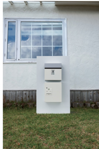
【戸建住宅用 宅配ボックス「COMBO(コンボ)」コンパクトタイプ】 【戸建住宅用 宅配ボックス「COMBO(コンボ)」コンパクトタイプ 設置例】