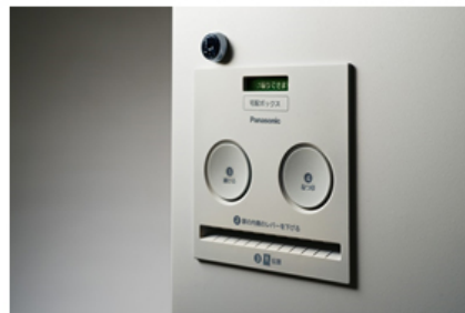
【戸建住宅用 宅配ボックス「COMBO(コンボ)」操作部】