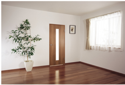
【インテリア建材 「Refoms(リフォムス)」 内装ドア<ミディアムチェリー柄>